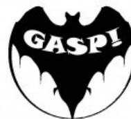
Gruppo Archeologico Speleologico Pugliese CAI Gioia del Colle