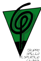
Gruppo Speleologico Vespertilio CAI Bari