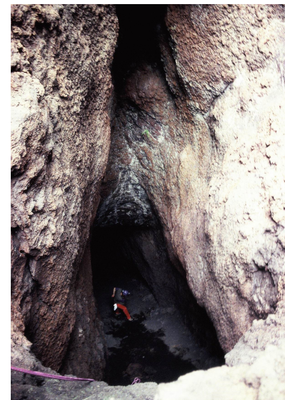
Grotta degli Archi – Etna (CT)